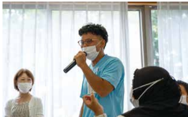
話し合った結果を発表しました

外国籍職員交流会はお互いの考え方を知り相互理解を深める良い場であり、未来の働きやすい職場づくりのヒントをもらえる場でもありました。