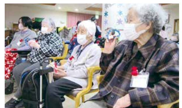
利用者(希望者)全員参加です