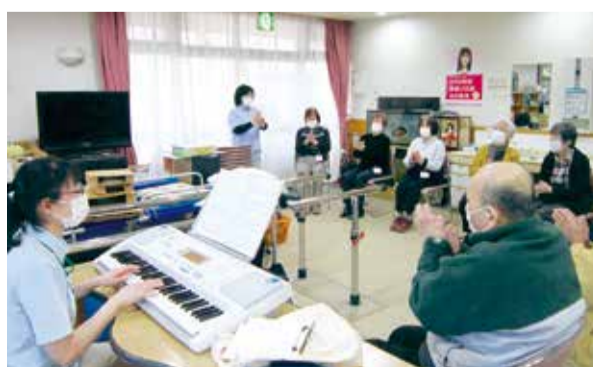
職員の伴奏もあります