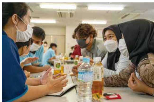
良い人間関係を築くためにはをテーマに話し合い