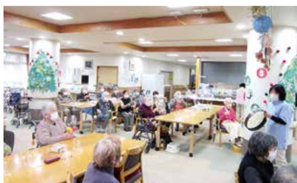
職員のお声掛けで始まります

て合奏するので、とても集中して取り組まれています。色々なリズム打ちをし、飽きることなく簡単な楽器を使うので普段参加しない方も楽しまれています。皆様に練習して本番で成功した時は達成感で盛り上がり、普段感じられない一体感を感じています。このように生き生きと取り組まれている姿を拝見し嬉しく思います。今後も続けていきたいと思