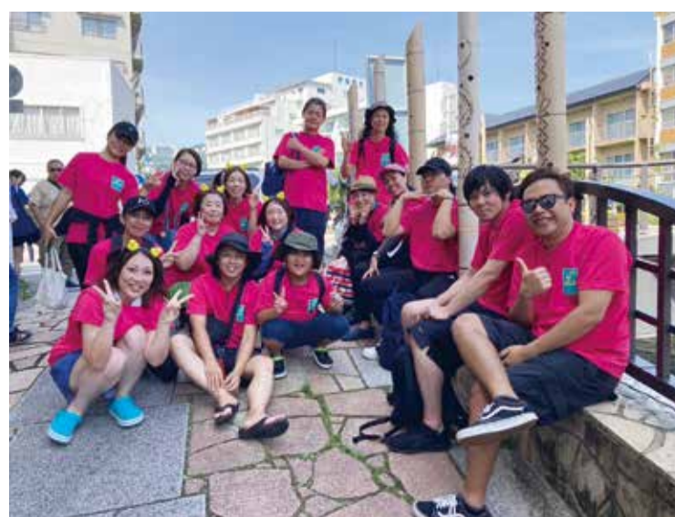
ピンクがまぶしいチームいとうの杜 2年連続出場