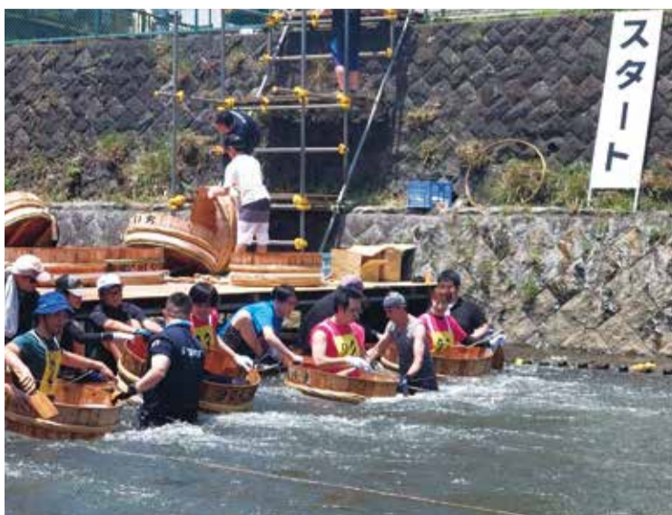
スタート地点 4, 5名ずつのスピード勝負

松川で熱い戦いが行われた夜、天の川では織姫と彦星がデートしていました・・・ 応援団長