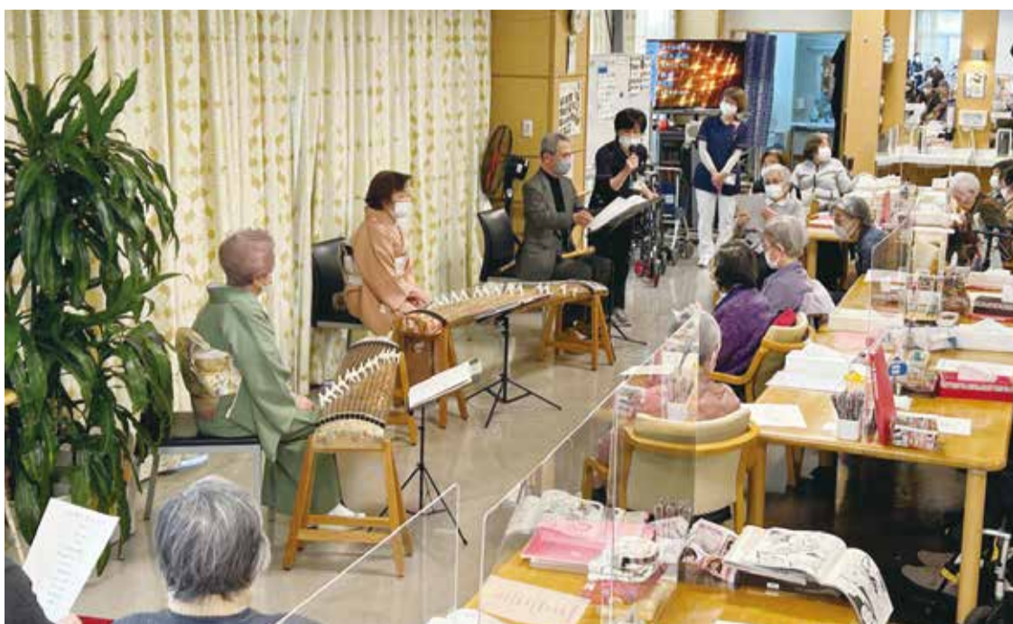
琴と尺八の演奏会