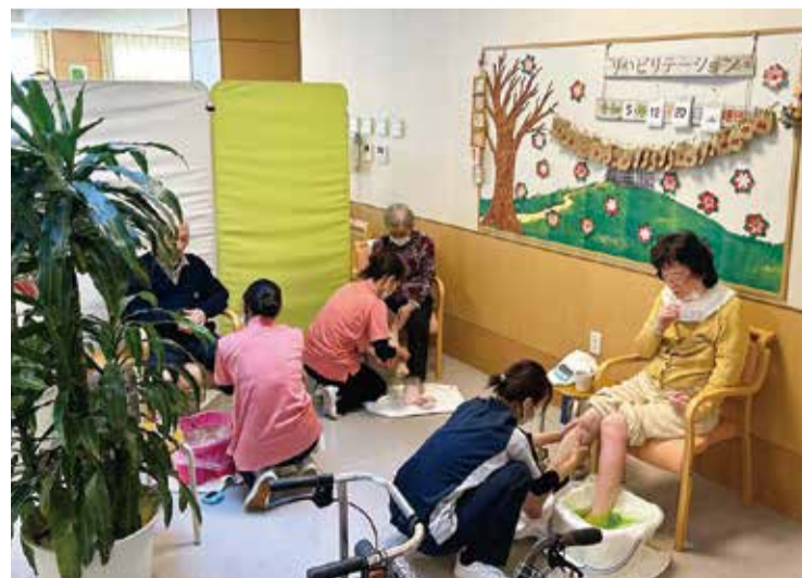
足湯とフットマッサージ