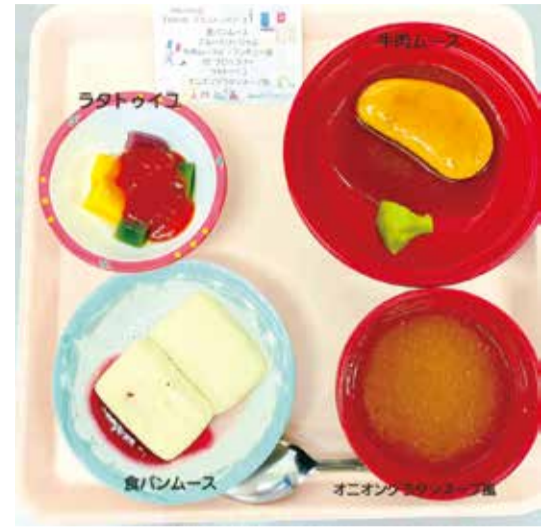
フランス ペースト食

らず、七夕の雰囲気が出しづらいつらいつら状況でしたが、この天の川水ようかんが良い仕事をしてくれて、