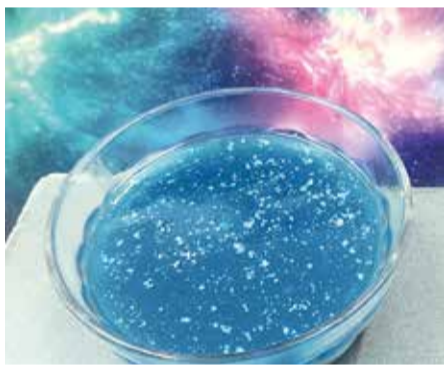
天の川水ようかん

食事形態に関わらず、隣の席同士で「美味しいね」と笑い合いながらお食事を楽しんで頂けるよう、今後も栄養課一丸となって頑張っていきたいと思います。