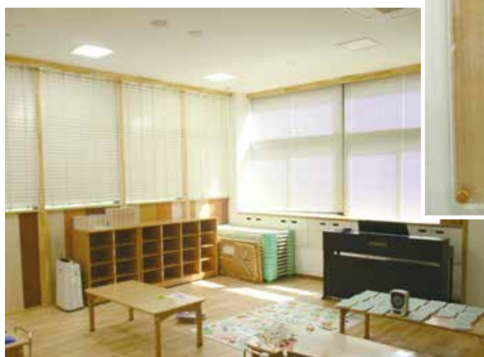
木の温もりを感じる室内です