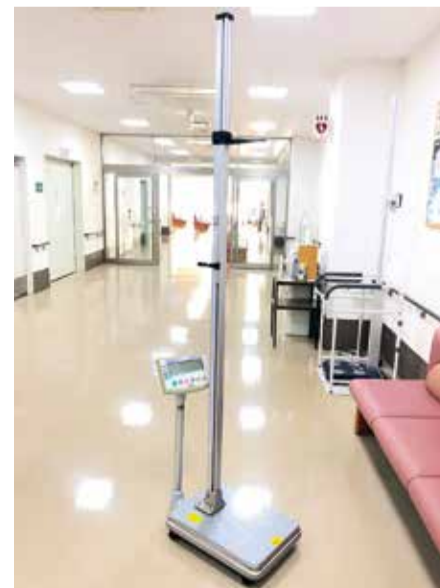
長年活躍してくれた当院の「身長・体重計」

道具と人間の間で、言葉は交わせませんが、「感謝」の気持ちで繋がることはできるのだと思います。当院を陰で支えてくれた「身長・体重計」に改めて心より感謝申し上げます。