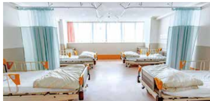
広々とした病室に改修しました