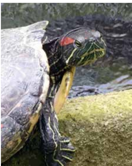
カメさん満面の笑み

豊川さくら病院には、子どものリハビリテーション外来があつて、小さなお友達もたくさん通院しています。順番