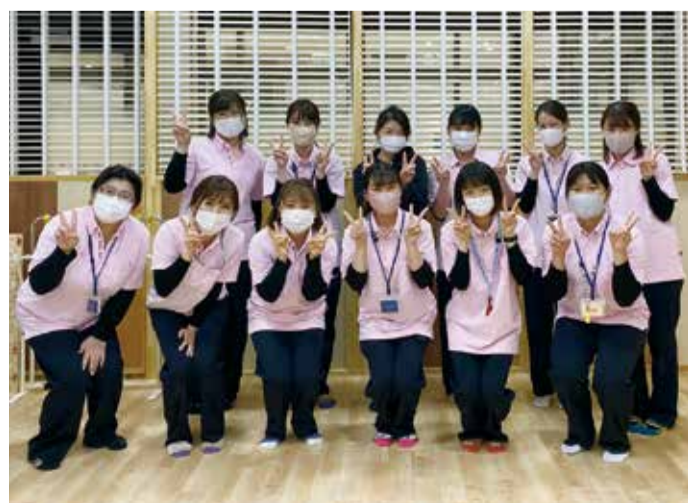
みんなで楽しく過ごしましょう