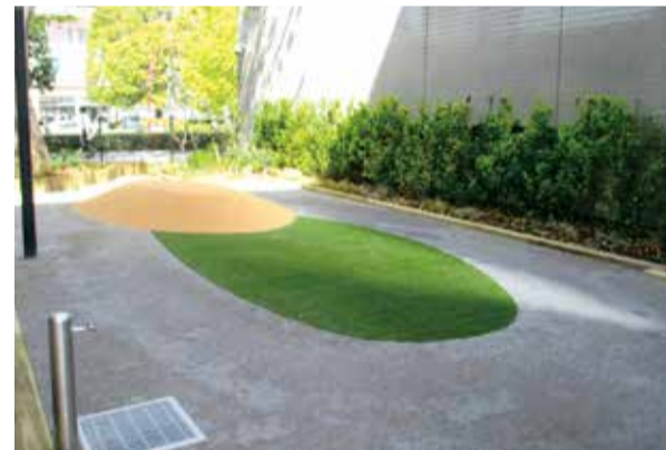
皆が大好きな「てつニワ」