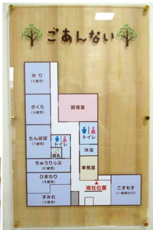
迷わずお部屋に行けるかな？