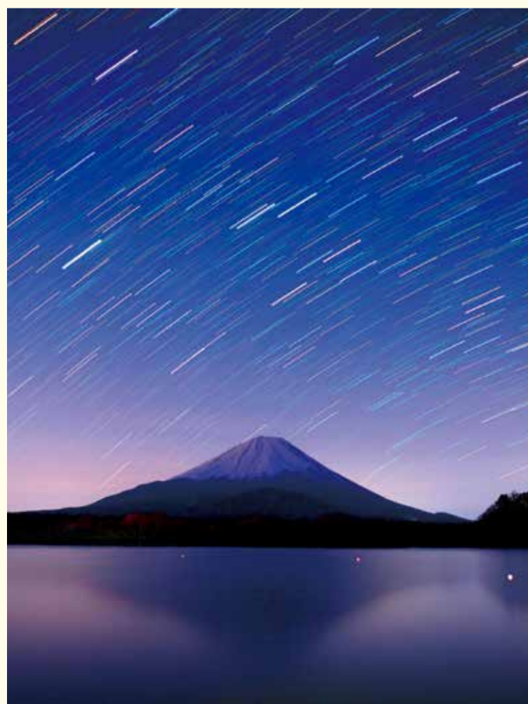
「密を避けて」シリーズ・パート2、逆さ富士が撮りたくて

カメラ：OLYMPUS E-M5 mark II (OM-D) レンズ：Panasonic LEICA SUMMILUX 15mm/F1.7 露出：20sec × 60回 (20min), f2.0 ISO：1600