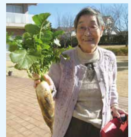
立派な大根に育ったわね!