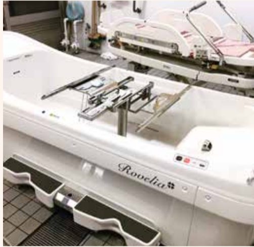
洗練されたデザイン

8月3日 いとうの杜の特殊浴槽が新しく生まれ変わりました。その名も『Rovelia』、ゆとりあるワンランク上のバスタイムをお届