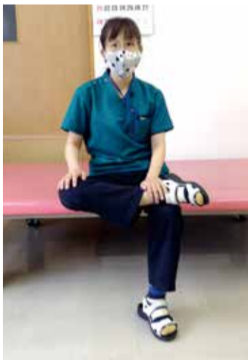
①椅子に座って写真のように足を組む