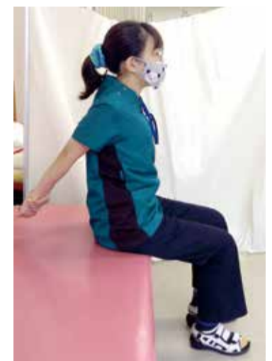
②肘を伸ばしたまま、両手を背中から離していく ・そのまま10秒保つ ・これらを3~5回繰り返す