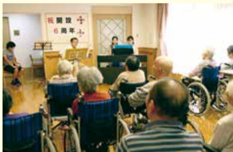
開設記念日にて6回公演を実施