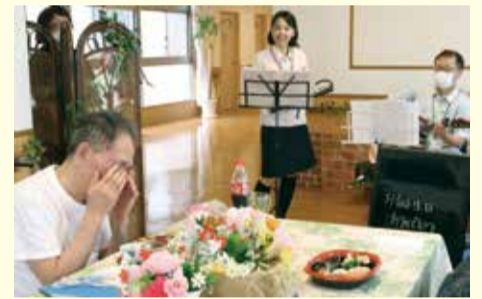
ご馳走とサプライズの生演奏に思わず涙…