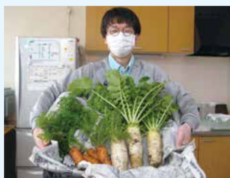
今年はとてもいい出来でした!