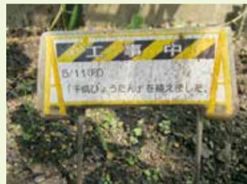
ひょうたん工事中です