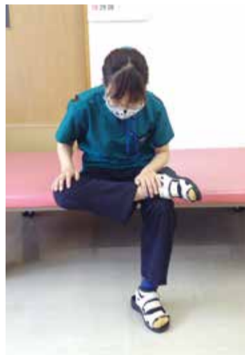
②手を膝と足首に置き、そのまま上体を前に倒していく ・そのまま10秒保つ ・これらを3~5回繰り返す ・足を組み替え、反対のお尻も伸ばしていく ・上体を倒すのが辛い方は、足を組んだままの姿勢を10秒保ってみましょう