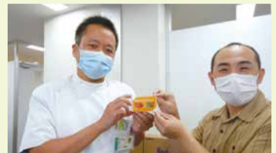
お食事テイクアウト券を受け取る院長