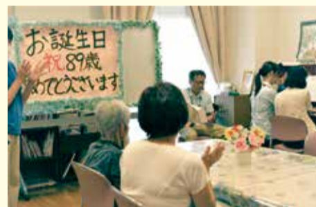
ご家族にもご来園頂き一緒にお祝い