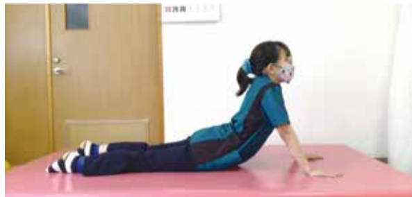
②そのまま肘を伸ばし上体を起こしながら反っていく ・そのまま1分程度姿勢を保つ ・休憩をはさみ、同じ動きを2回繰り返す