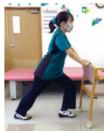
①テーブルの端もしくは椅子の背に手をつき、右足を後ろに下げて、右膝を伸ばす ※この時、踵は床にしっかりとつけるのがポイント

アキレス腱の柔軟性があると、歩く時につま先に体重が移動しやすくなり、歩行姿勢も改善されます。立ち上がる時も立ち上がりやすくなります。立っている姿勢も良くなり、腰への負担も軽減されます。