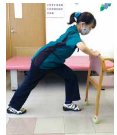
②そのまま10秒保つ ・これらを3~5回繰り返す ・反対の足も同様に行う