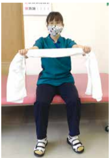
①タオル(スポーツタオルやバスタオル等)をしっかり張るように両手で持つ ※肩幅より少し広めで持ちましょう