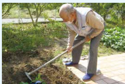
土は柔らかくした方がよく育つんだよ

取り組みの中で、ご利用者同士のコミュニケーションツールになったり、ゆっくりと力強く成長する野菜を見て「私も頑張らないといけないね」と歩行訓練を懸命に励まれる方がいたり、野菜作りを通して得られるものが多くありました。今後も在宅サービスを必要とされるご利用者の日常を保ち「ここで過ごしたい」と思っただけのような場所であり続けられるよう、職員一同努めていきたいと思っております。