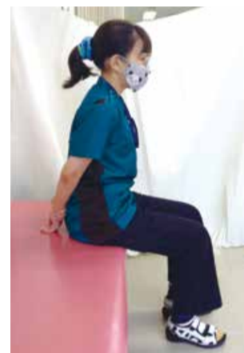
①両手を背中の後ろ(腰のあたり)で組む

胸が開くことで、背骨が伸びて姿勢が良くなり、首・肩・腰への負担が軽減されます。肩甲骨の動きも引き出され、腕の動く範囲が広がります。