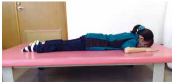
①うつ伏せになり、両手を床につく

この運動で股関節の前面が伸ばされ、骨盤が前傾し、背骨も伸びる方向に動き、姿勢が良くなります。