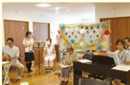
リクエスト曲の演奏に合わせて歌っています