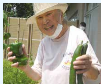
満面の笑み!素敵です!