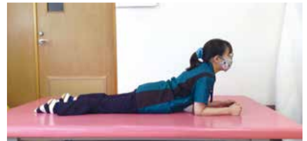
③②の写真が辛い方は、手から肘までを床につけたまま、上体を起こしてみましょう