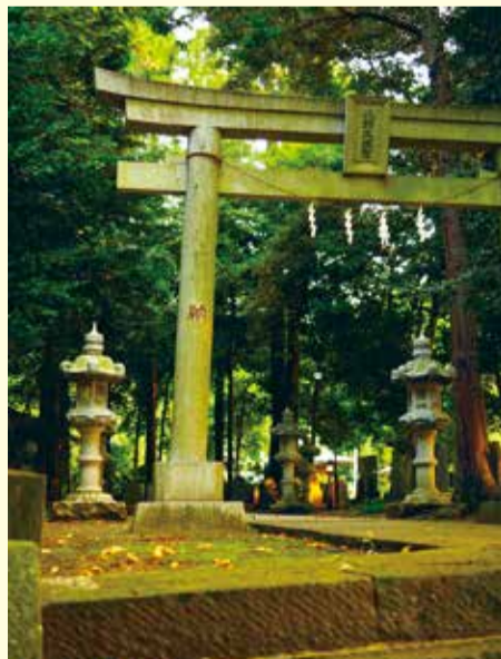
表参道から、右奥に主たる合殿を臨む鳥居には「北野天満宮」の文字も見えます

所沢ロイヤル・ワム・タウンの南東に「北野天神社」という神社があります。近くの交差点(「北野天神前」)にも名称が入っていますし、きっと地域への馴染みも深く、近隣にお住いの患者様・利用者様でもご存じの方が多いのではないのでしょうか。しかしながら、所沢に移り住んで四半世紀以上が経つワタクシ、手前の道路を行き来することは数多くあれど、まだこの神社を訪れたことがなかったのです…そこで、新型コ