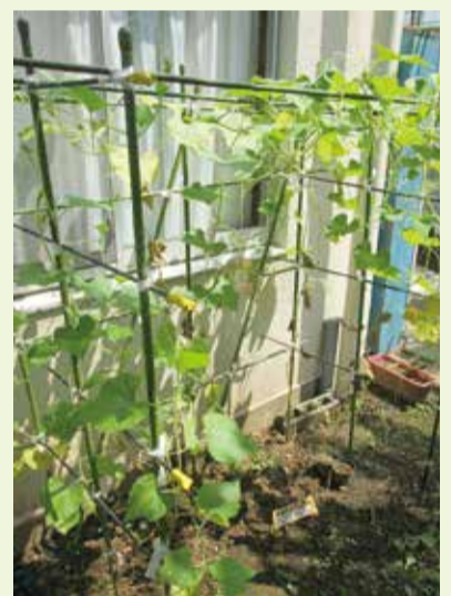
手作りのひょうたん棚です