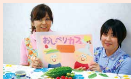
ようこそおしゃべりカフェへ

そう~おしゃべりカフェは「お茶」と「おやつ」と「歌」を楽しみに、いらして下さるようです。お手伝いさせていただいている私たちがキーボードとギターで伴奏し、歌集