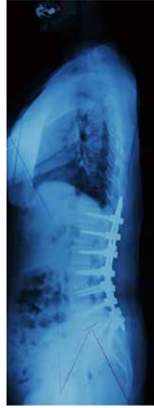
図2：症例1 後方矯正固定術後、術前の不良バランスは改善