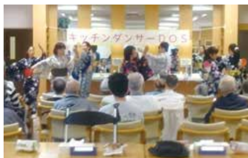
キッチンダンサー DOS様