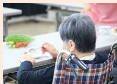
季節を視覚と味覚で楽しんでいただきます

を見ながら、なつかしい歌を、みなさんがうたい綴ってくださいます。時々、その歌にまつわる思い出話をして下さる方のお話をきっかけに、みなさんで盛り上がります。