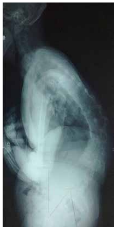
図4：症例2 術後X線、正面・側面像ともバランスは改善