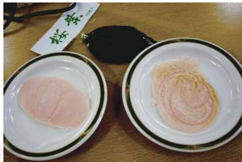
ホットプレートで焼いた桜餅