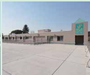
広々とした屋上バルコニー

入居者の皆様が在宅での生活を継続し、その人らしい生活を送れるよう一人ひとりの生活を