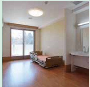
ゆったりとした個室