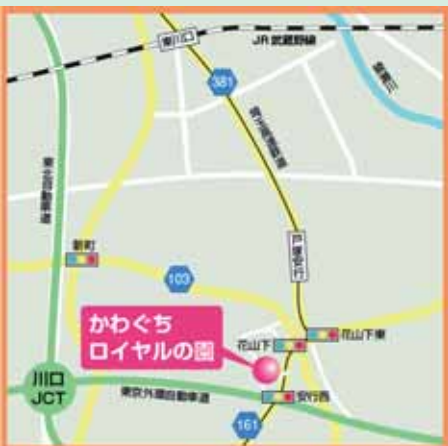
〒330-0813 埼玉県川口市西立野48 電車でお越しの際は 埼玉高速鉄道「戸塚安行駅」下車、徒歩8分