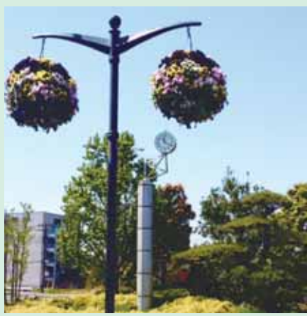
「造園の街 安行」駅は花と緑に溢れおしゃれです

川口市は荒川を隔てて東京都に接する埼玉県の南端に位置し、錆物や植木などの産業が有名です。その歴史は古く江戸時代までさかのぼります。十数年前より鉄道等の交通手段の整備が進み住宅都市化が進んでいます。平成23年には隣の鳩ヶ谷市と合併し更に大きくなりました。現在は首都東京と隣接しているという利便性と緑豊かな地域として着々と発展しています。